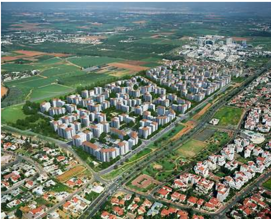
הדמיית מבט עילי על השכונה. אכלוס צפוי תוך 3 שנים