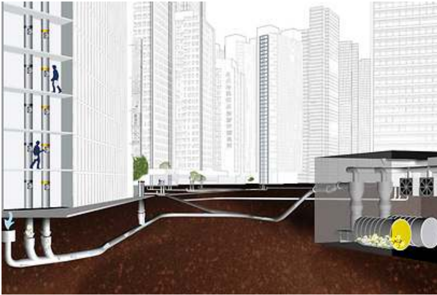
הדמיית מערכת פינוי האשפה

השכונה מאופיינת בבנייה רוויה ותכלול בניינים בני עד 7 קומות, ובמשרד האדריכלים מספרים כי היא תהיה ירוקה באופייה והמבנים שבה ייבנו במטרה לחסוך אנרגיה ולנצל אנרגיה זמינה. כמו כן, מתוכננים להיבנות בשכונה שטחי ציבור נרחבים וכל רחוב יראה אחרת מבחינת המרקם האדריכלי שלו. כלומר, ההבדלים בין הרחובות הראשיים, רחובות הביניים והסמטאות הקטנות יתבטאו בשוני בריצוף, בתאורה ובריהוט הגן